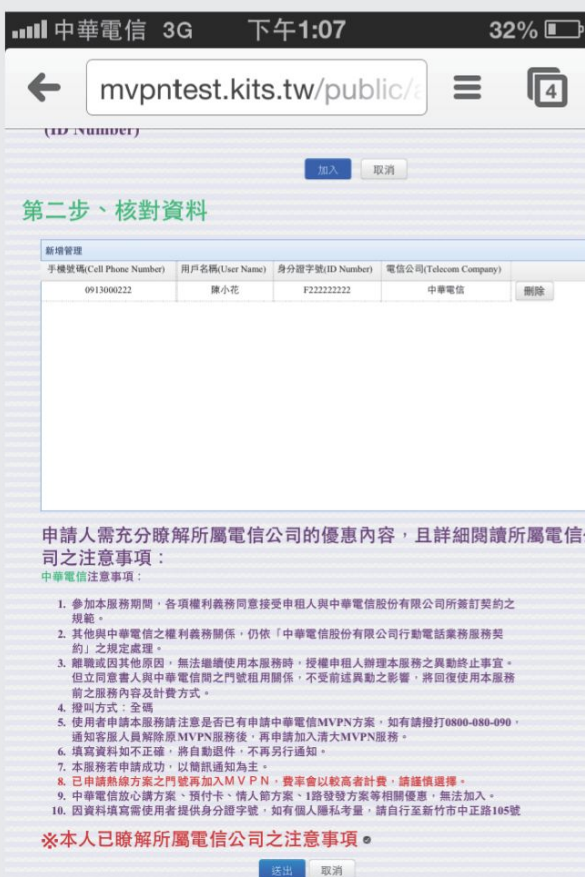
第二步：核對資料及勾選注意事項最後按下送出