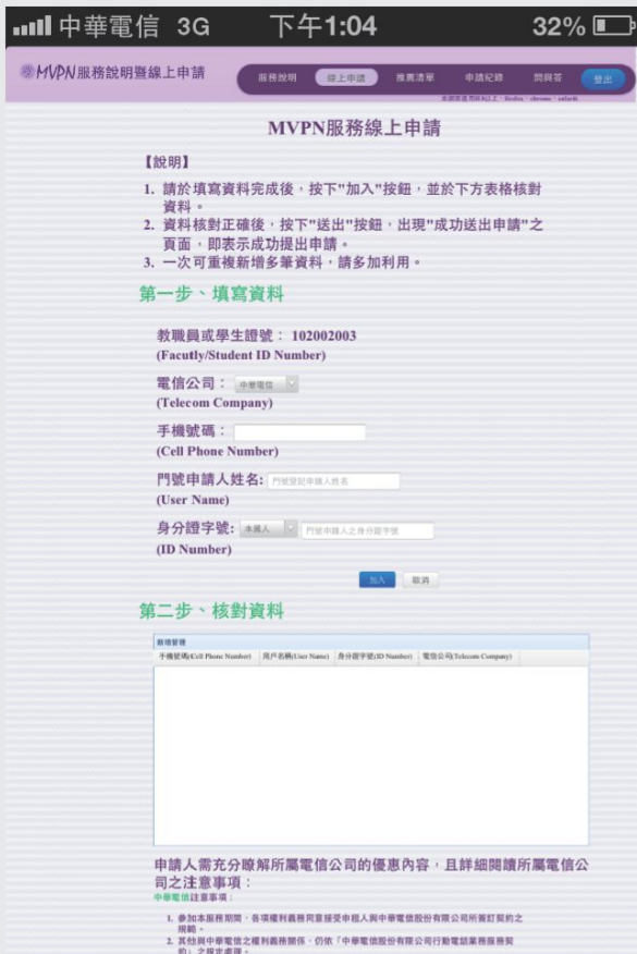
進入線上申請頁面