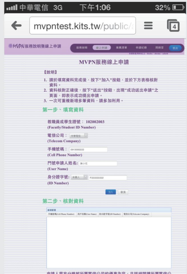
第一步：填資料並按下加入按鈕